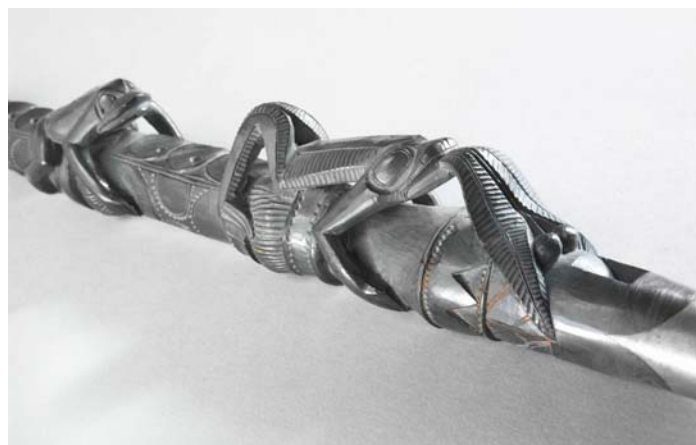
Flûte à conduit, anonyme, Iles de la Reine Charlotte, Canada, début 19ème, E.1219