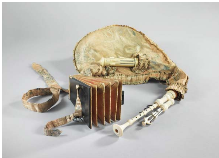
Musette de cour, Chédeville, Paris, début 18ème, E.571