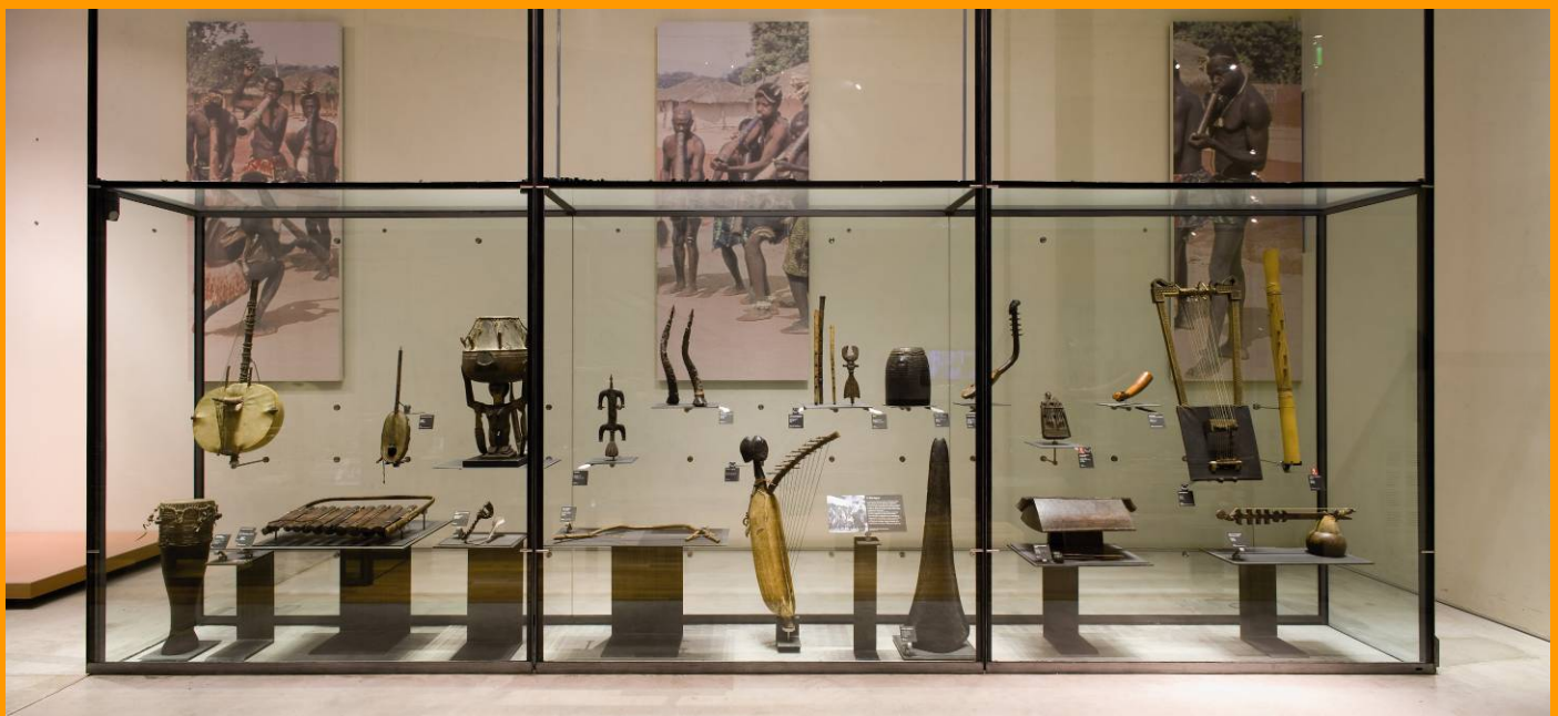
Vitrine Afrique